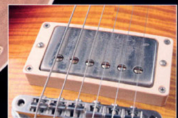
HOT PICKUPS AMBER CROSSPOINT '59 PAF