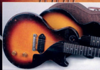
GIBSON VINTAGE LES PAUL JUNIOR 1955 & 1956