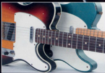
FENDER TELECASTER 50er RELIC & 60er CUSTOM LTD