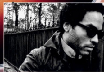
LENNY KRAVITZ IM ELECTRIC LADY STUDIO