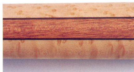
▲ネックは、マホガニーをバズアイ・メイプルとエボニーで挟んだ5ピース構造。木の地肌そのままの感触による仕上げがスムーズな弾き心地をもたらしてくれる。