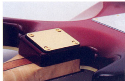
▲ネック・ジョイントはボルトオン・タイプながら、ヒールを低くするスラント形状により、ハイ・ポジションでのプレイアビリティを確保している。

●SPECIFICATIONS ● ●ボディ・キルト(写真) ●フレーム・エキンチック・メイプル・ベント・トップ、マムヨ(写真) ●アルダー・バック(ライト・ウェイト・アッシュ、マホガニーも選択可) (1,000円) ●ネック・バズアイ・メイプル/エボニー/マホガニー5ピース ●指板・マダガスカル・ローズウッド ●ピックアップ・スタジオ・エリート・ハムキャンセル・シングルコイル(フロント&センター)、同ハムバッカー(リア) ●セイモア・ダンカン・クラシック・スタック(フロント&センター) ●スラント・ピックアップ・タイラー・ダンカン・トレンバッカー(リア) ●セレクター ●コントロール・ボリューム・ミック・ブースト・プリアンプ ●コントロール・ボリューム・プリアンプ ●5ウェイPU ●セレクター、リード/リズム・スイッチ、シリーズ・ハムキャンセル/スプリット/パラレル・ハムキャンセル ●スイッチX3 ●カラー・トランス・レッド、他(写真はオプションのトランスジウム・バースト) (1,900円) ●その他・オプションなしの通常価格1,029,000円