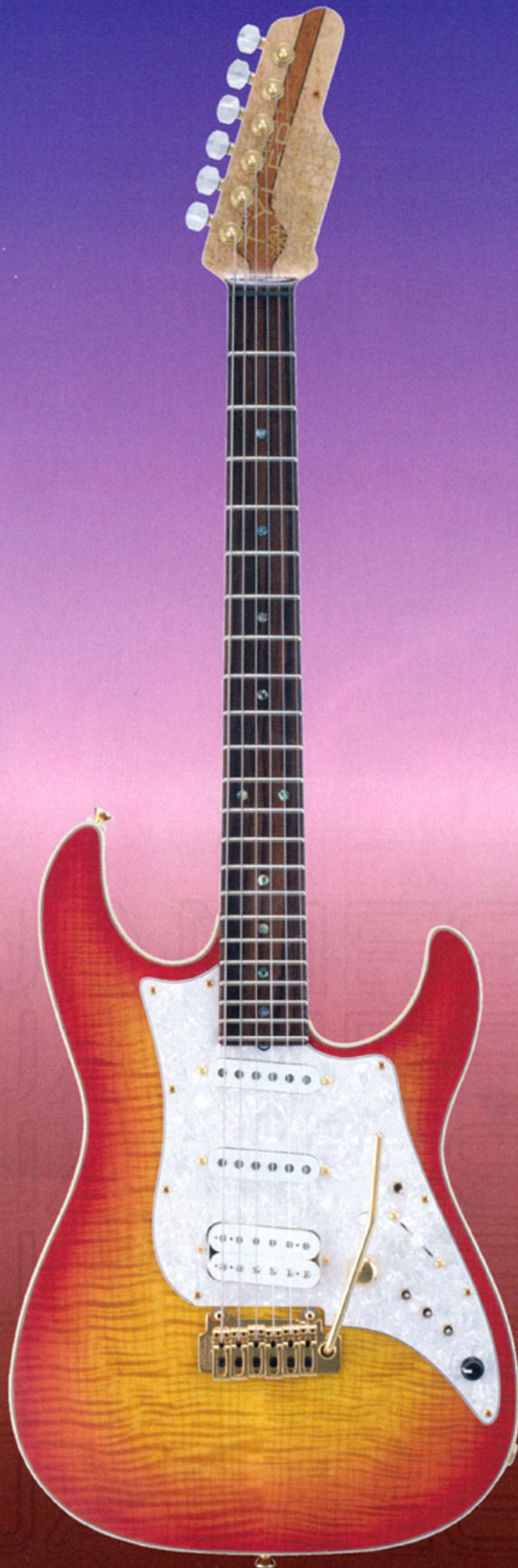
cherry sunburst flamed maple bent top Duncan pickups