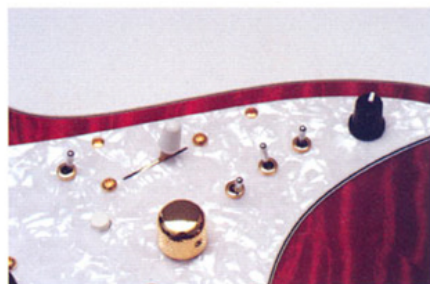
▲右の黒いツマミはミッド・ブースト。隣の3つのスイッチは各PUのシリーズ/スプリット/パラレル切り替え。白いボタンはミッド・ブースト・プリセットだ。